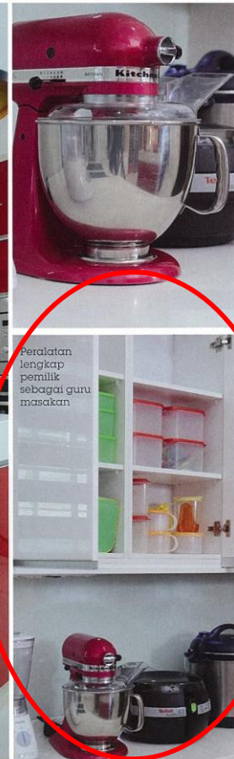
Peralatan lengkap pemilik sebagai guru masakan