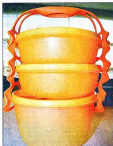
以“打包”概念而研发的手提式三层保鲜盒，符合人体工程学的手提设计，能牢固地卡住三个不同容量的圆碗。

他说，“借著来自俄罗斯的哈萨克斯坦发射场的联盟号TMA-6飞船，成功把标明日期容器发送到外太空，然后进行著重在人体细胞成长零危害的大型科技研究。这也证明了Tupperware的持久耐用性连外太空最微小敏感的含量都能抵抗。”