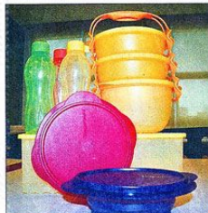
Tupperware品牌的保鲜塑料容器，不仅是结合创新点子和新科技的高品质的产品，同时也符合环保意识，让产品真正达到对人体完全、无毒、无臭又兼顾环保的品质标准。